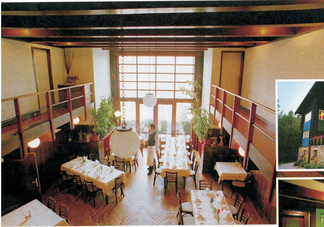
Haus Khuner am Kreuzberg in Payerbach von Adolf Loos: Das schlichte Äußere lässt das komplizierte und großzügige Raumgefüge nicht erahnen.